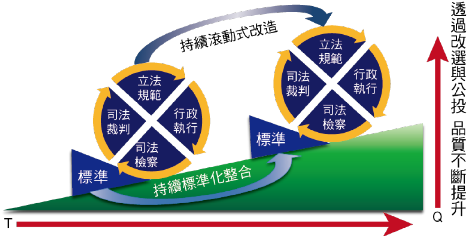
圖：持續提升真善美聖國度的國際標準(ISO)程式圖