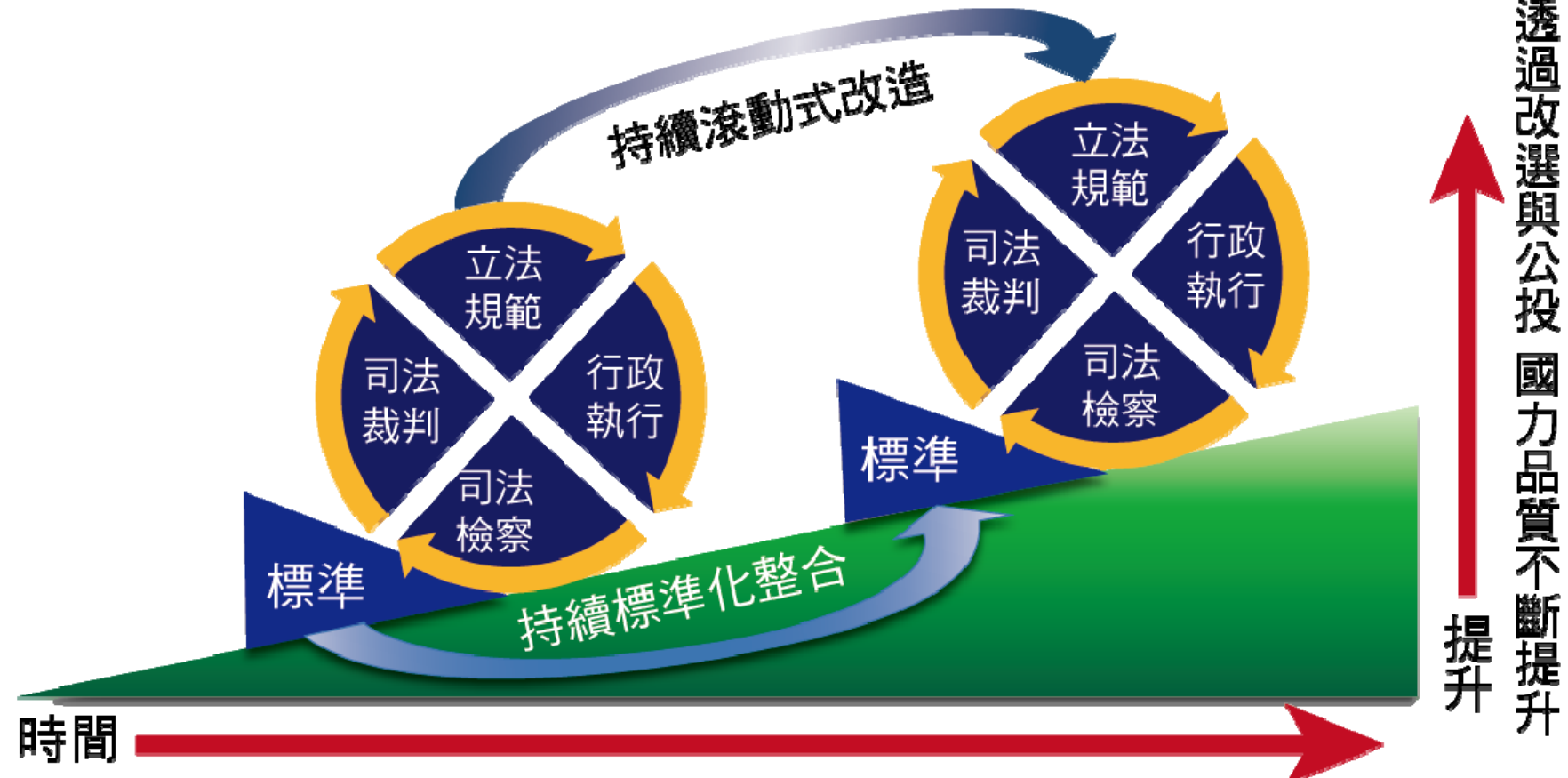
圖1：持續提升真善美聖國度的國際標準(ISO)程式圖